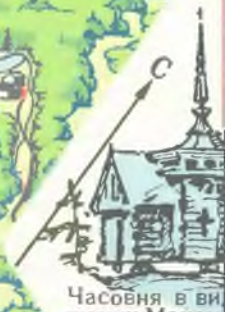
Часовня в шапке Мономаха