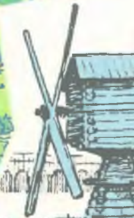
Деревянная мельница (XIX)