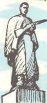
Петровская крепость. Памятник советским воинам.