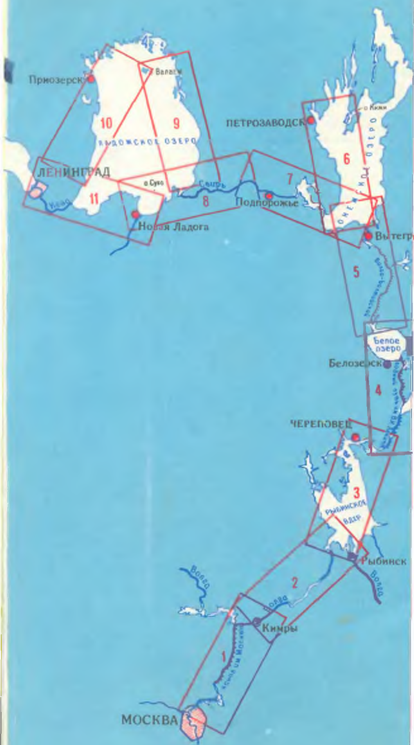
СХЕМА РАСПОЛОЖЕНИЯ МАРШРУТОВ

ГЛАВНОЕ УПРАВЛЕНИЕ ГЕОДЕЗИИ И КАРТОГРАФИИ МИНИСТЕРСТВА ГЕОЛОГИИ СССР МОСКВА 1967