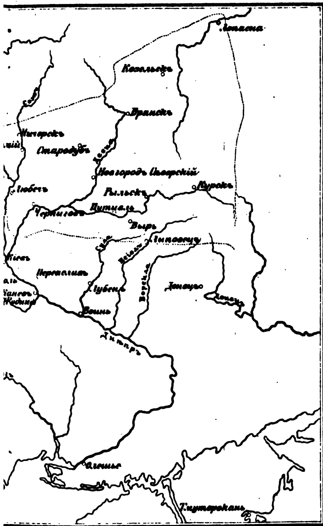
КАРТА ТУЛА С. А. АНДРИЯ, С. С. С.