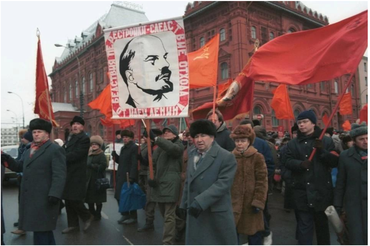
Митинг против развала Союза. Москва, 1991 г.