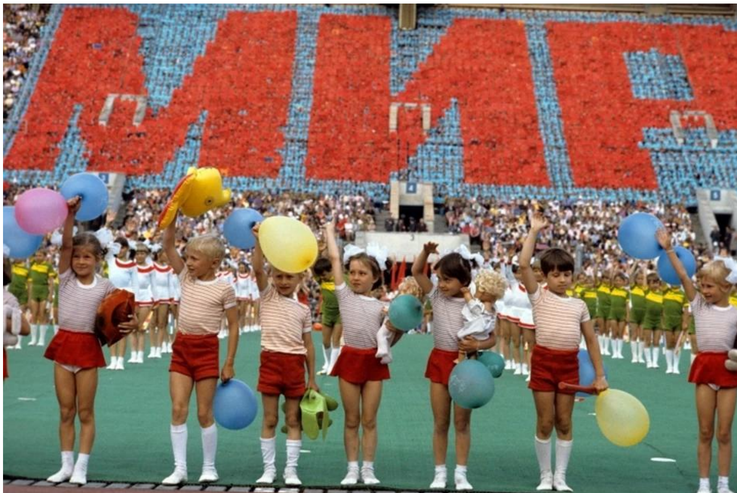
Летняя Спартакиада народов СССР, 1983 год.

Четверть века спустя после распада СССР мы до сих пор не можем понять — почему это произошло? Ведь весной 1991 года за сохранение единой страны на референдуме проголосовало 77,7% ее граждан. А уже к концу того же года, пользуясь поражением ГКЧП, многие союзные республики моментально состряпали свои местечковые голосования, на которых люди требовали уже независимости. Например, на Украине захотевших жить отдельно от остального Союза набралось 90%! А в Армении — и вовсе 99%!