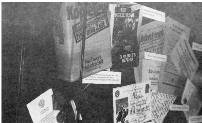
Форум имени Льва Копелева в Кёльне. На стенде книги, письма и награды