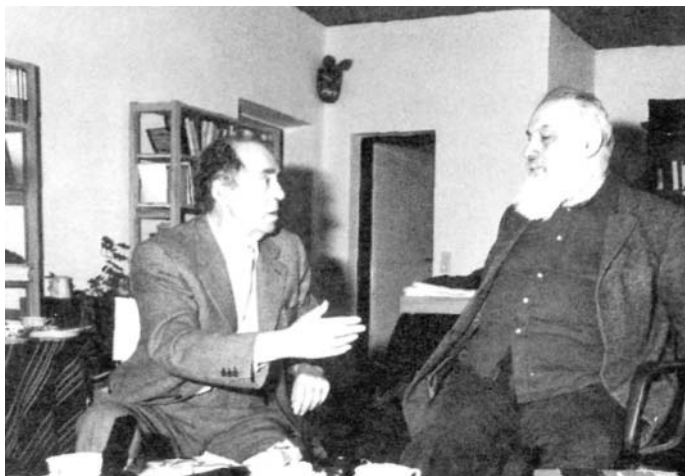
Берлин, 1981. Генрих Бёлль и Лев Копелев вспоминают, почему они стреляли друг в друга