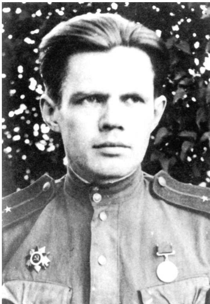
Иван Рожанский, 1944