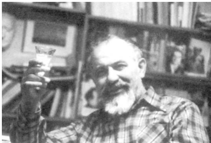
Лев Копелев, Москва, 1973