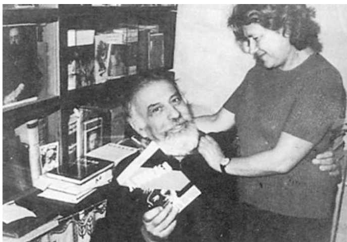
Лев Копелев с первым русским изданием книги «Хранить вечно» (Ардис, 1975) и его жена Раиса Орлова. Книга переведена на 12 иностранных языков