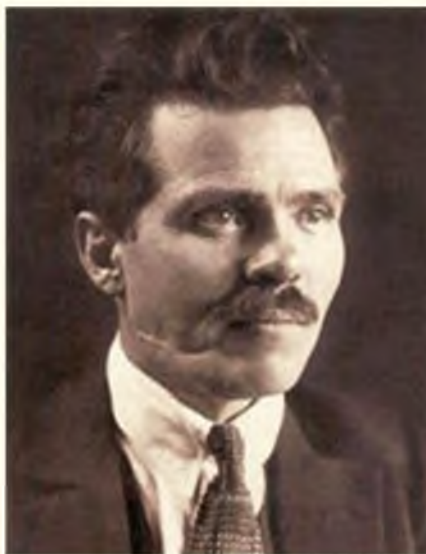
Махно за границей

В истории махновской контрразведки мы сталкиваемся со сложным вопросом отношения анархистов к спецслужбам и карательным органам. Наиболее свободолюбивая идеология, принципиальный враг всякого принуждения, анархизм всегда был непримирим к подобным структурам своего главного противника – государства. Между тем, любая действующая организация анархистов вынуждена использовать орудия и механизмы «старого общества», чтобы проложить людям путь в безвластное будущее. Вынуждена по той простой причине, что других действенных механизмов просто нет. И главный вопрос здесь в том, смогут ли анархисты контролировать это орудие или переродятся под его влиянием и породят в итоге еще одно государство, разве что под черными флагами. Этот вопрос в полной мере касается и одного из крупнейших анархических движений в истории человечества, – махновщины.