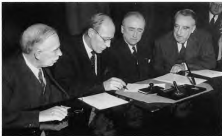
Подписывается соглашение о займе. 6 декабря 1945 г. Слева направо: Кейнс, Галифакс, Бирнс (госсекретарь США) и «Судья» Винсон