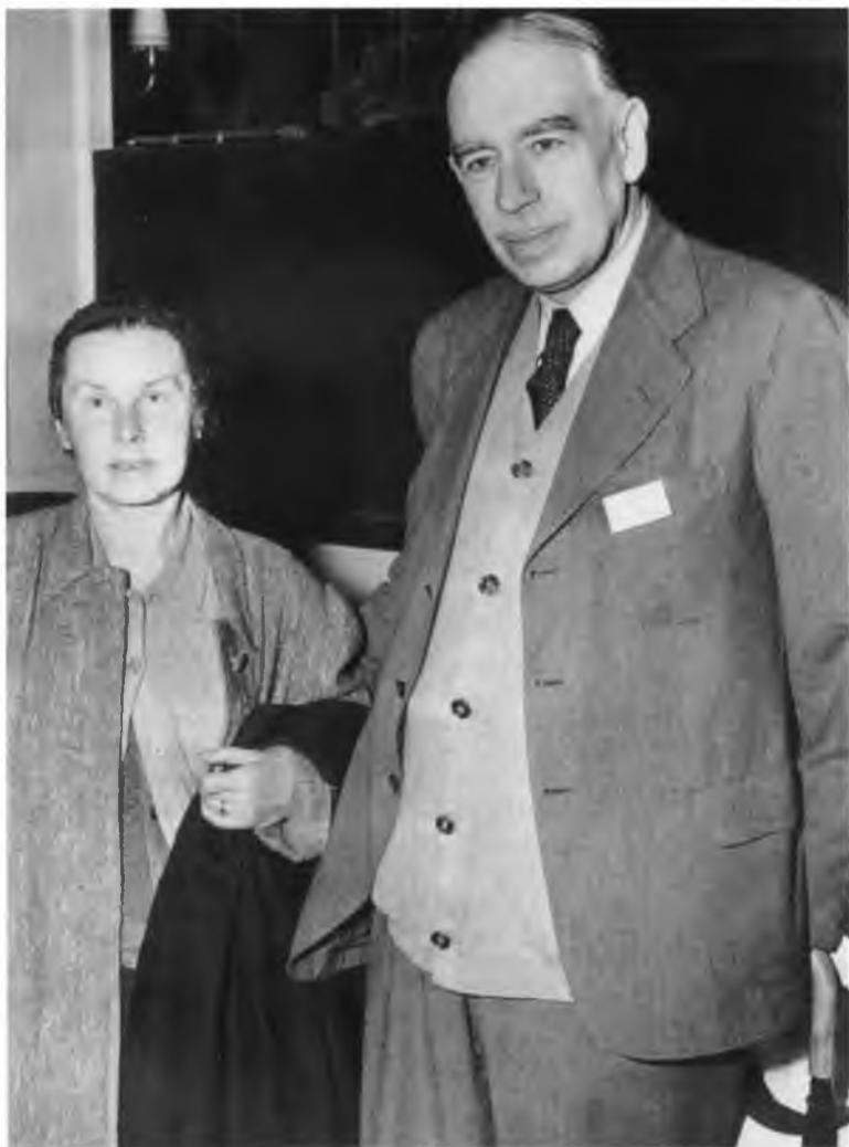
Кейнс и Лидия в Бреттон-Вудсе. Июль 1944 г.