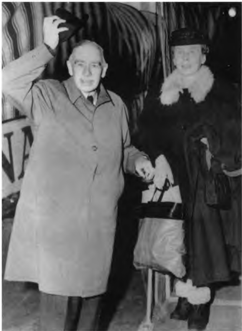
Кейнс с Лидией. «Из Саутгемптона прямо в палату лордов». 17 декабря 1945 г.