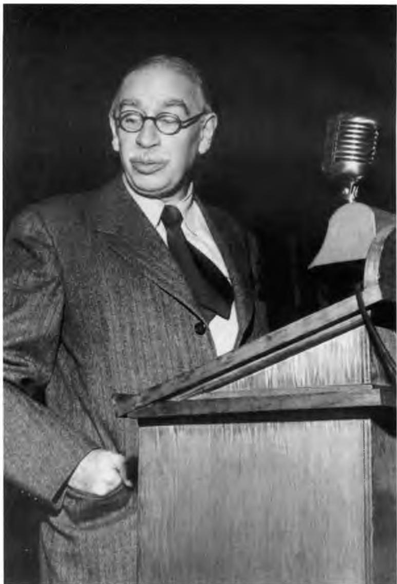
Кейнс произносит речь на конференции в Саванне: «Никакая "злая фея" не испортит крестины МВФ»