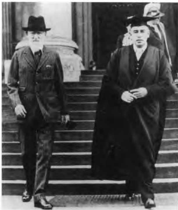
Джордж Бернард Шоу и Мейнард Кейнс. (Кембридж, 1926 г.)