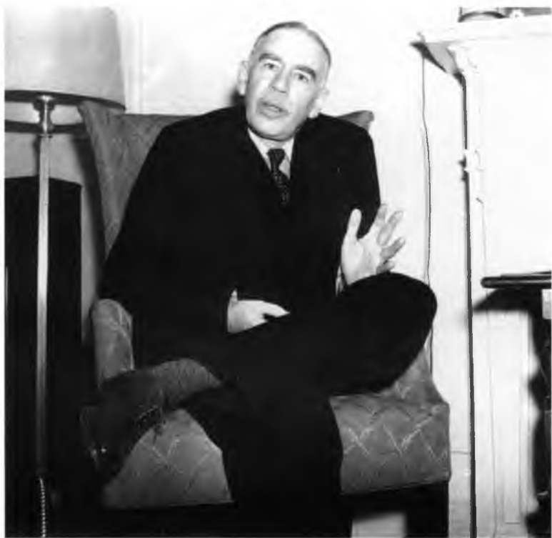
Джон Мейнард Кейнс. Вашингтон, 12 мая 1941 г.