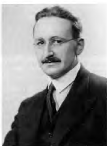
Фридрих Хайек, 1931 г.