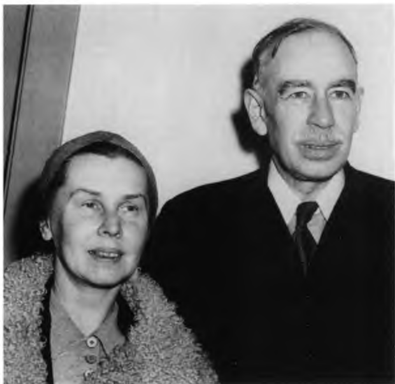
Кейнс и Лидия по прибытии в Нью-Йорк. 8 мая 1941 г.