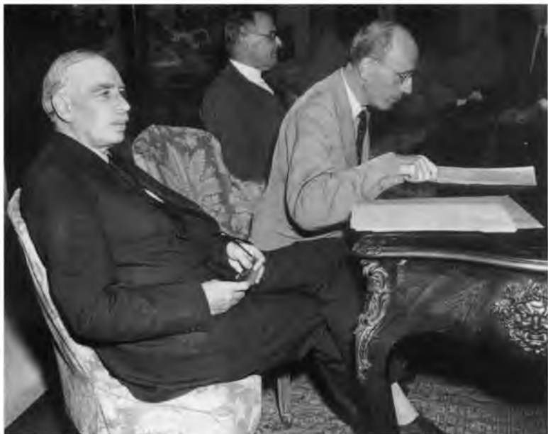
Начало переговоров о займе. Кейнс и Галифакс на пресс-конференции в Вашингтоне. 12 сентября 1945 г.