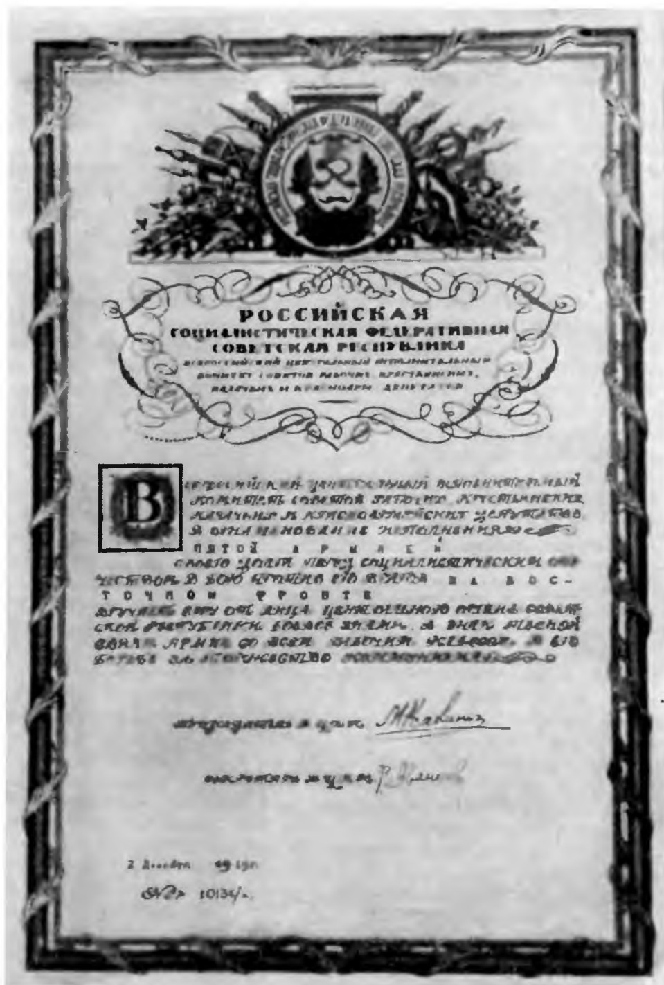
Грамота ВЦИК о вручении 5-й Армии Боевого Красного Знамени, 1919 г.