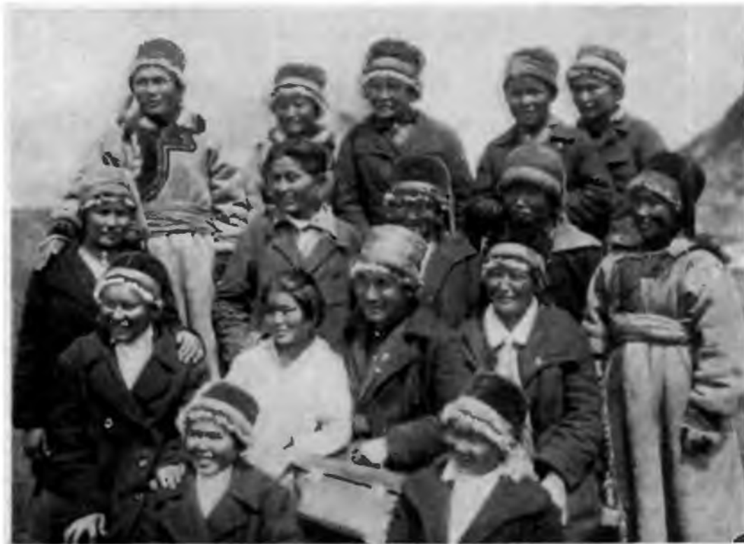
Группа комсомольского актива коммуны им. Кулади Аюхаева. Горный Алтай. 1931 г.

В соответствии с новым Уставом колхозам вручались государственные акты на бессрочное пользование землей. В связи с этим в 1935—1937 гг. в колхозах проводились большие землеустроительные работы, ликвидировались чересполосица, дальнотелье и т. п. Выдача актов производилась в торжественной обстановке, вызвала у крестьянства политический и трудовой подъем. Первыми получали акты передовые колхозы. Вот как описывает газета «Омская правда» вручение государственного акта одному