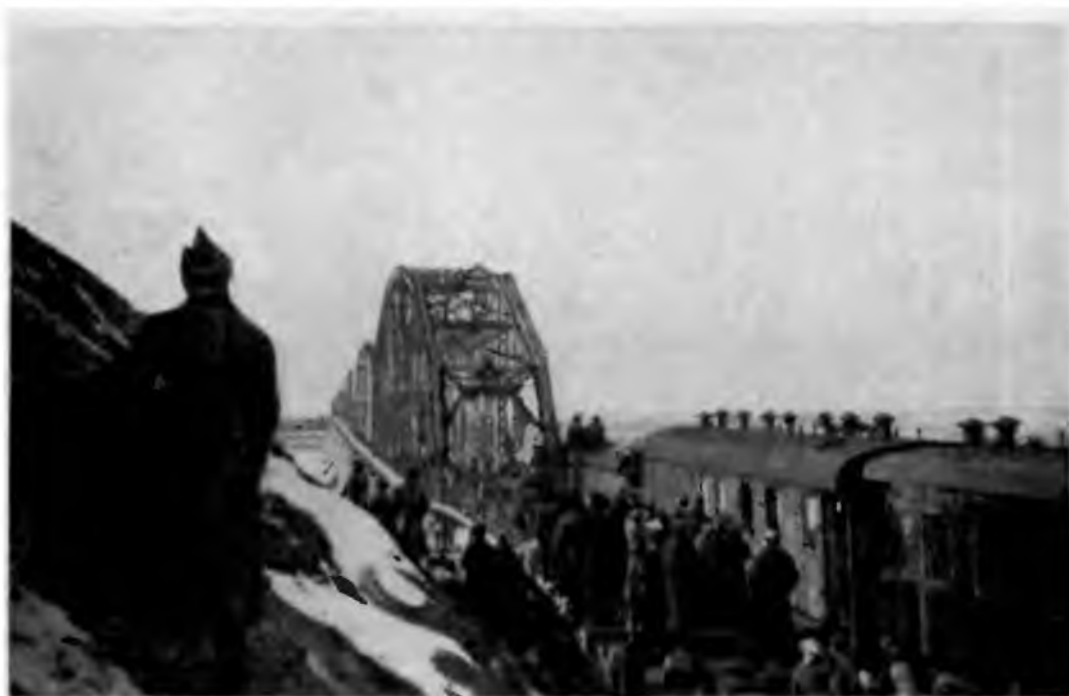
Открытие моста через Амур. Хабаровск. 1926 г.

Рост капиталовложений на переоборудование, расширение и строительство новых предприятий показывает, что государственная промышленность Сибири в 1926—1928 гг. вступила в начальный период своей технической реконструкции. К октябрю 1928 г. основные фонды цензовой промышленности Сибирского края возросли по сравнению с 1925 г. на 41%. Половина основных фондов, созданных в дореволюционный период, была рекон-