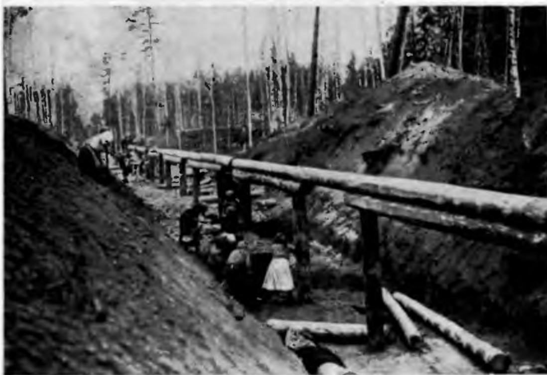
Общий вид строящейся встаклады лесовозной дороги в Кашкинском районе Западно-Сибирского края. 1931 г.

Однако наряду с успехами имелись и недостатки, обусловленные рядом трудностей. Не был выполнен план по росту производительности