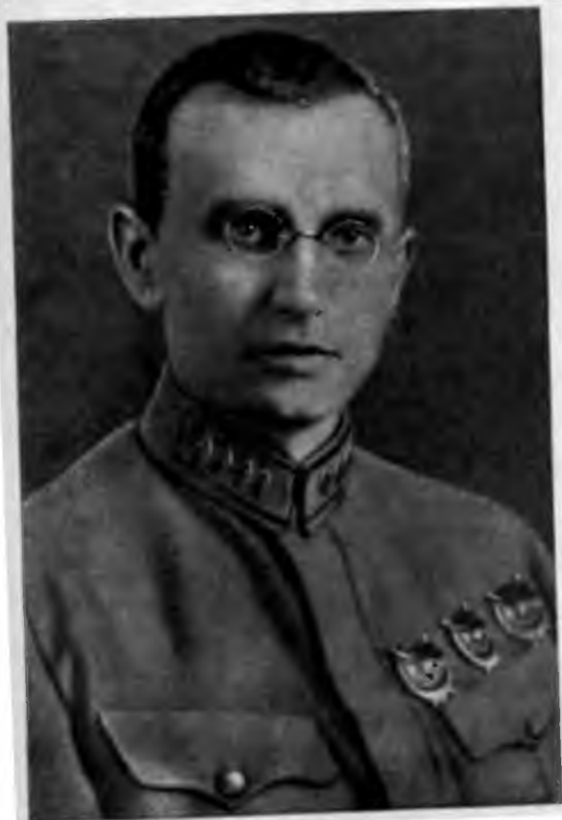
И. П. Уборевич