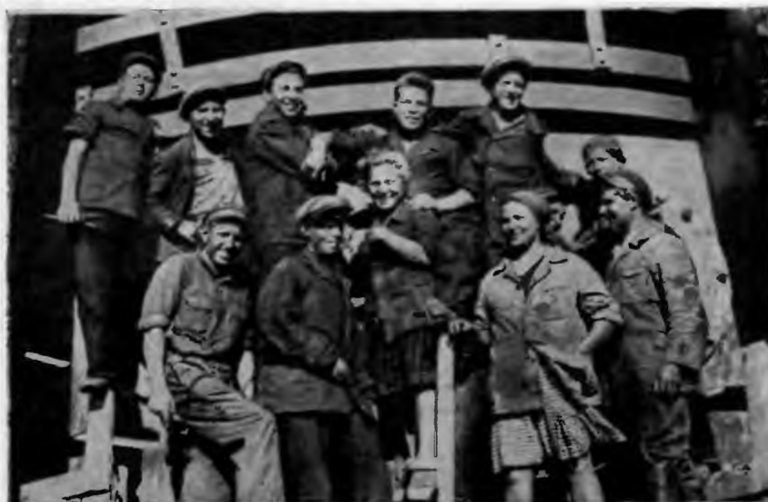
Комсомольцы-москвичи на строительстве Кузнецкого металлургического комбината.

На основе решений ВЦСПС и краевых органов была проведена организационная перестройка профсоюзов: ликвидированы некоторые окружные отделы и райкомы Союзов, организованы цеховые и сменные комитеты, создан на предприятиях, в совхозах и учреждениях институт профгруппоргов. При активном и непосредственном участии широких масс