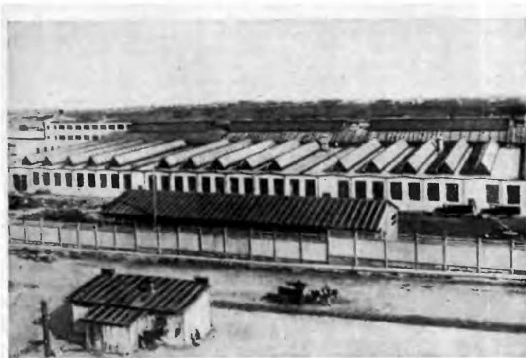
Общий вид завода «Энергомаш». Хабаровск. 1936 г.

В начале ноября 1935 г. бюро Восточно-Сибирского крайкома ВКП(б) рассмотрело вопрос о развитии стахановского движения в крае и дало всем партийным организациям указания по развитию и руководству движением новаторов производства. 7 В ноябре—декабре 1935 г. бюро Западно-Сибирского крайкома партии обсудило доклады секретарей ряда горкомов и райкомов партии о руководстве стахановским движением. 8