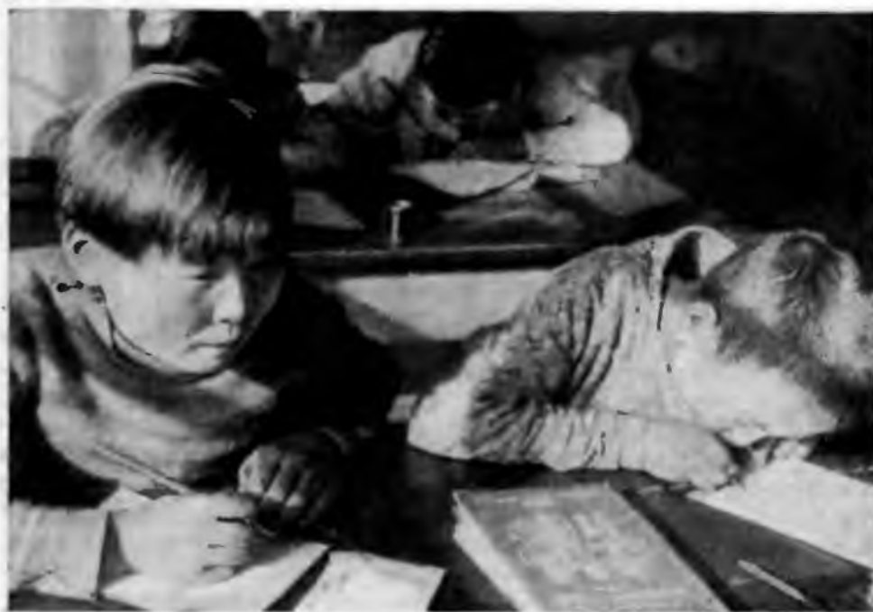
Ребята-ороченцы на занятиях в школе. Камчатка. 1936 г.

В области культурного строительства в годы первых довоенных пятилеток в Сибири, как и в СССР в целом, были достигнуты исключительные успехи, причем в основном была ликвидирована и сама разница между