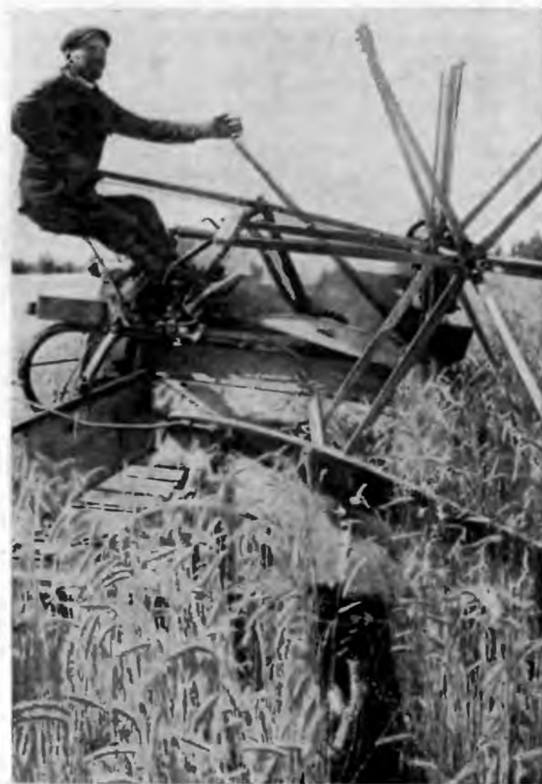
Уборка урожая в коммуне «Красный пахарь». Западно-Сибирский край 1931 г.

создано свыше 3200 ударных бригад, число ударников достигло 38 500 чел., или 6.4% всего трудоспособного населения колхозов. Широкое развитие получили такие формы соревнования, как встречный план и общественный буксир. В конце 1930 г. колхозы Западной Сибири выделили 540 бригад общественного буксира отстающим колхозам и 290 бригад буксира в помощь единоличникам.