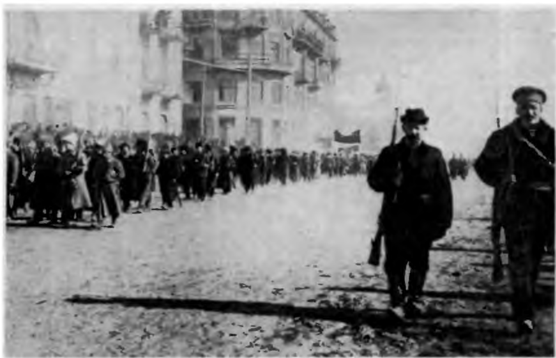
Красная гвардия Читы. 1917 г.

В августе—сентябре за передачу власти в руки Советов высказались железнодорожники Красноярска, Томска, Барнаула, Нижнеудинска, Боготола, Иланской, Читы, Владивостока и других мест. Съезд рабочих и