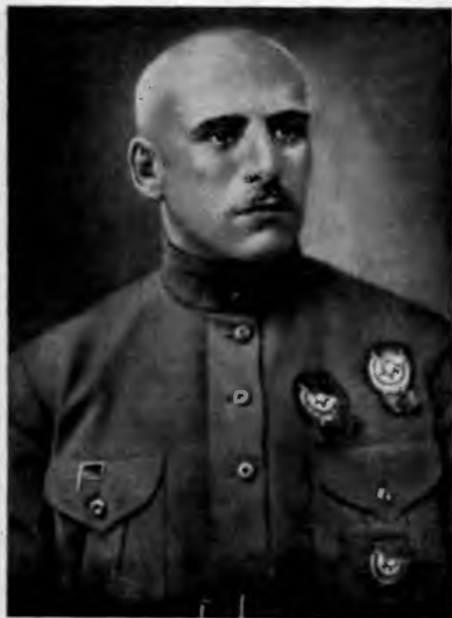
В. К. Блюкер.