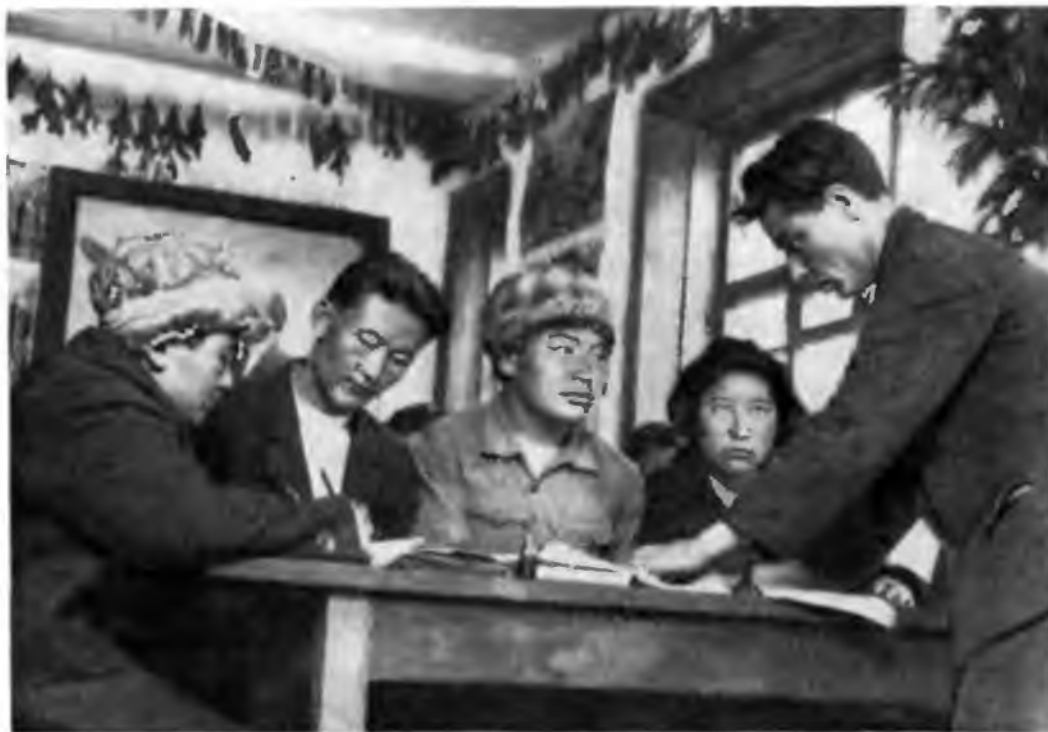
Занятия в Ойротской совпартшколе. 1931 г.

Огромную помощь в подготовке национальных кадров оказали высшие и средние специальные учебные заведения Москвы, Ленинграда, Иркутска, Томска, Новосибирска и других городов. Кроме того, по направлению из центра в национальные районы Сибири прибывали специалисты разных отраслей знаний.