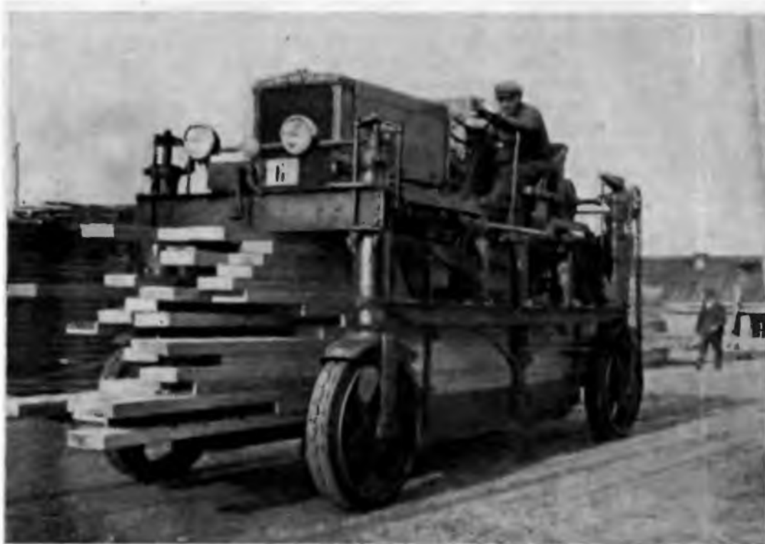
Перевозка пиломатериалов автовозом на Игарском лесокомбинате. Игарка. 1935 г.

о развертывании всекузбасского соревнования шахт. Вопросы участия во всесоюзных конкурсах обсуждались Восточно-Сибирским и Дальневосточным крайкомами, Иркутским и Черемховским горкомами партии, партийными и профсоюзными организациями, собраниями коллективов шахт, рудников и цехов, а также на участках, в сменах, бригадах. Принимались обязательства по улучшению качества работы предприятий: повышению производительности труда и снижению себестоимости, вносились сменно-встречные планы, создавались новые ударные хозрасчетные бригады,