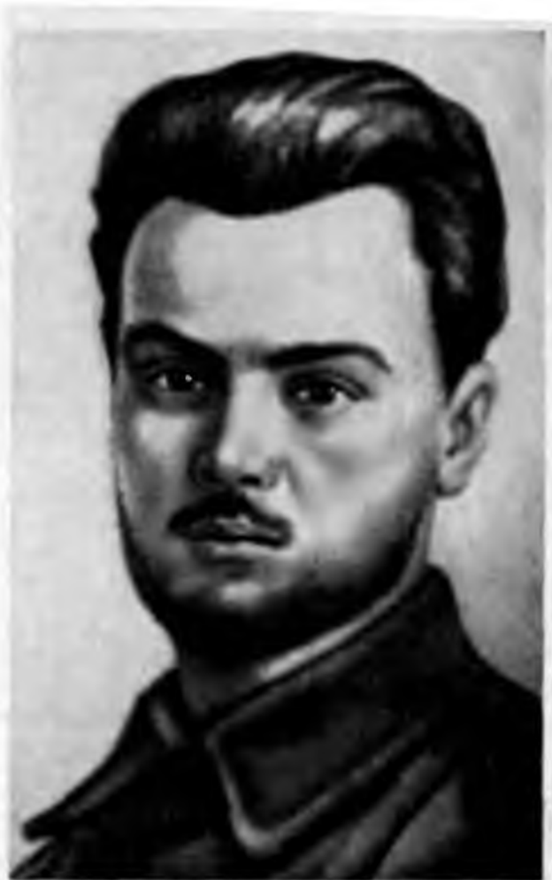
С. Г. Лазо.