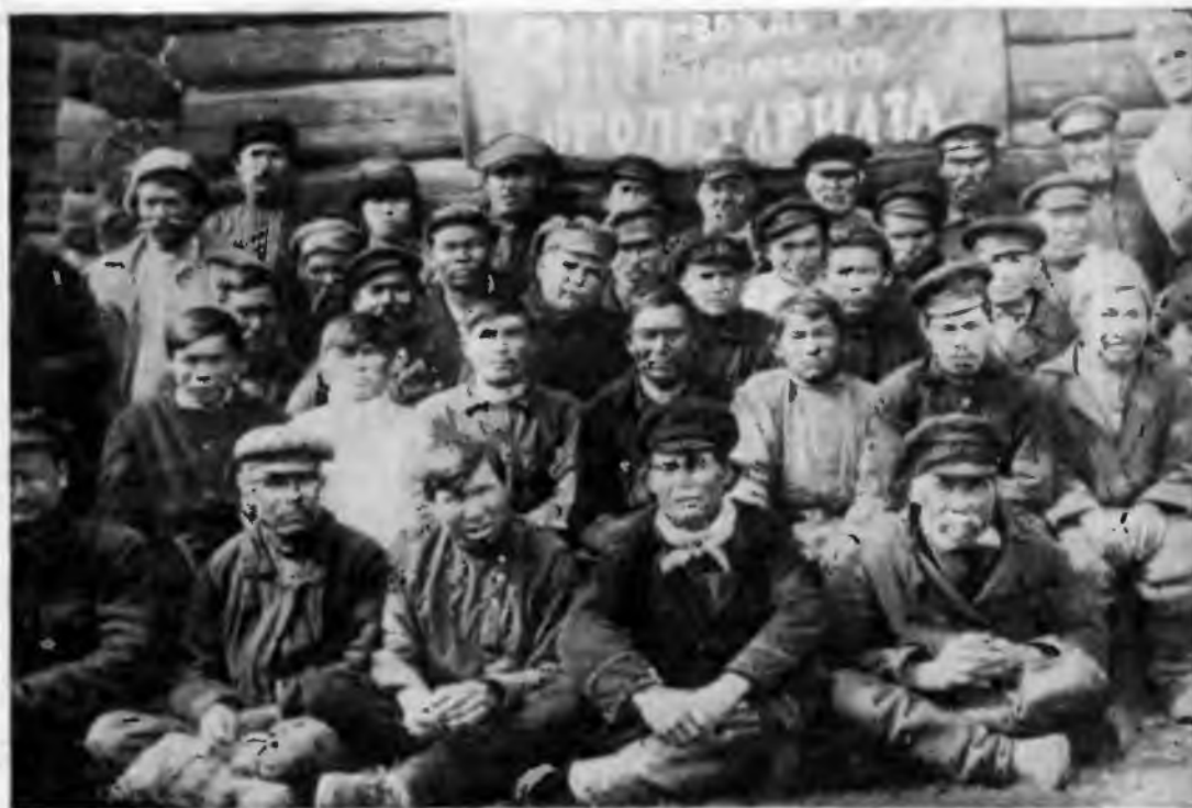
Первая районная конференция остяков (хаитов). Западно-Сибирский край. Нарымский округ, Александровский район. 1936 г.

больших трудностей. Создание базы энергетики и строительных материалов отставало от темпов нового строительства. Вследствие отдаленности от промышленных центров и отсутствия хороших путей сообщения новостройки получали промышленное оборудование нередко с большим опозданием. Имелось немало недостатков в организации работы и в использовании техники. Все это приводило иногда к затягиванию сроков строительства, отрицательно сказывалось на освоении новых производств и выпуске продукции.