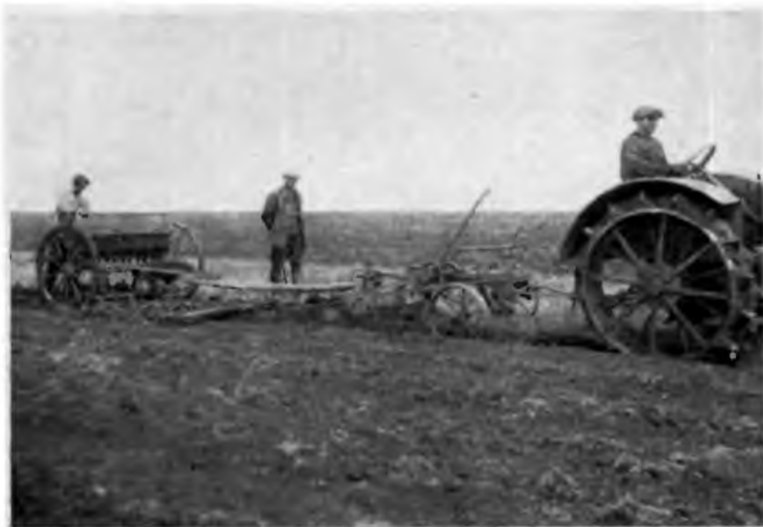
Новая техника на полях колхоза «Красный Восток». ДВК. 1933 г.

Колхозный строй открыл широкие просторы для развития производительных сил в деревне, для создания самого передового, высокоразвитого, механизированного сельского хозяйства, для зажиточной и культурной жизни всего крестьянства. Подводя итоги социальным преобразованиям в деревне, Программа КПСС отмечает: «Переход советской деревни к крупному социалистическому хозяйству означал великую революцию