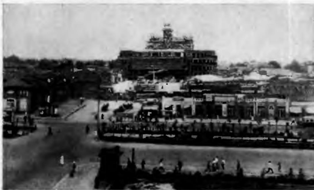
Строительство театра оперы и балета в Новосибирске. 1933 г.

строителей Кузнецкого металлургического комбината, театр завоевал здесь популярность и решением правительства был реорганизован в Сибирский государственный театр с местом постоянного пребывания в Новосибирске. Очень скоро театр стал гордостью новосибирцев. В своей творческой деятельности он ориентировался на опыт Московского художественного театра, сохраняя, однако, при этом свою оригинальность. Такие спектакли, как «Егор Булычев» и «На дне» А. М. Горького, «Аристократы» Н. Погодина, выявили творческое лицо «Красного факела» — театра современного, целеустремленного и страстного, склонного к глубокому психологизму. Уже через три года театр получил право уча-