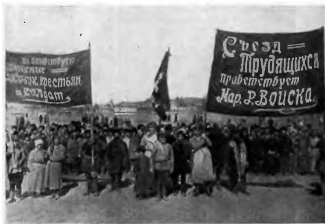
Части НРА приветствуют Съезд Советов трудящихся Прибайкалья. Март—апрель 1920 г.

Для обеспечения безопасности Советской республики с востока, закрепления освобожденной Сибири и оказания помощи трудящимся Забайкалья и Дальнего Востока в борьбе с интервенцией и белогвардейщиной соединения V армии были выведены к р. Селенге и к границам РСФСР с Монголией. В конце марта—апреле за Байкал выступила 30-я дивизия и за-