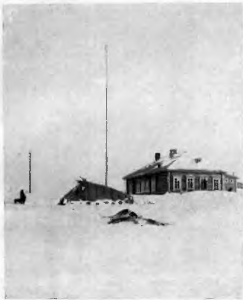
Внешний вид школы на Чукотке. 1933 г.

В последующие годы количество средних специальных учебных заведений несколько увеличилось. В 1937 г. в техникумах и рабфаках Бурятии обучалось около 2 тыс., в 12 техникумах и 4 профессиональных средних школах Якутии — свыше 2 тыс. чел. В Якутии началась подготовка таких новых специальностей, как техники, связисты, строители. В Хакасии и Горном Алтае открылись медицинские учебные заведения, а также алтайская театральная студия.