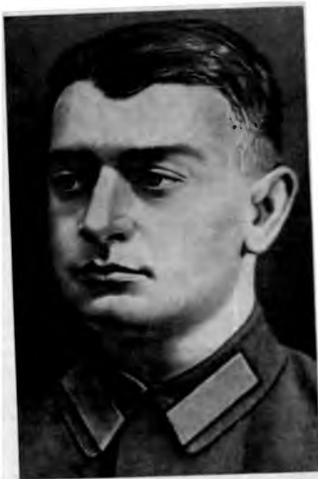
М. Н. Тухачевский.