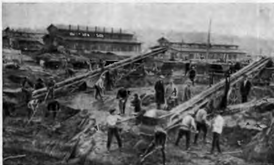
Кузнечстрой. Начало земляных работ под доменную печь. 1930 г.

В начале 1929 г. был проведен Всесоюзный смотр производственных совещаний. В Сибири он совпал с Урало-Сибирской «перекличкой угля и металла», начатой по инициативе газет «Уральский рабочий» и «Советская Сибирь». Во время переклички металлурги Урала и горняки Сибири выдвигали взаимные «счета-претензии», которые широко обсуждались на производственных совещаниях, цеховых, сменных и общих собраниях