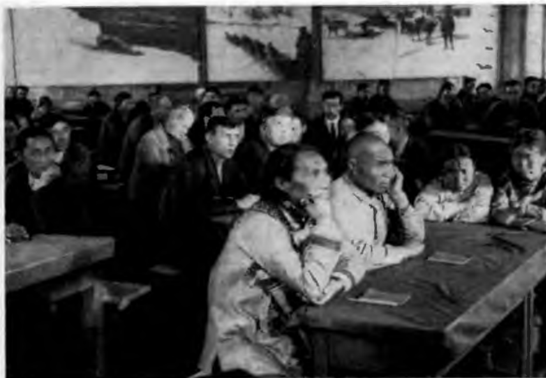
Участники съезда народов Севера во Владивостоке. 1937 г.