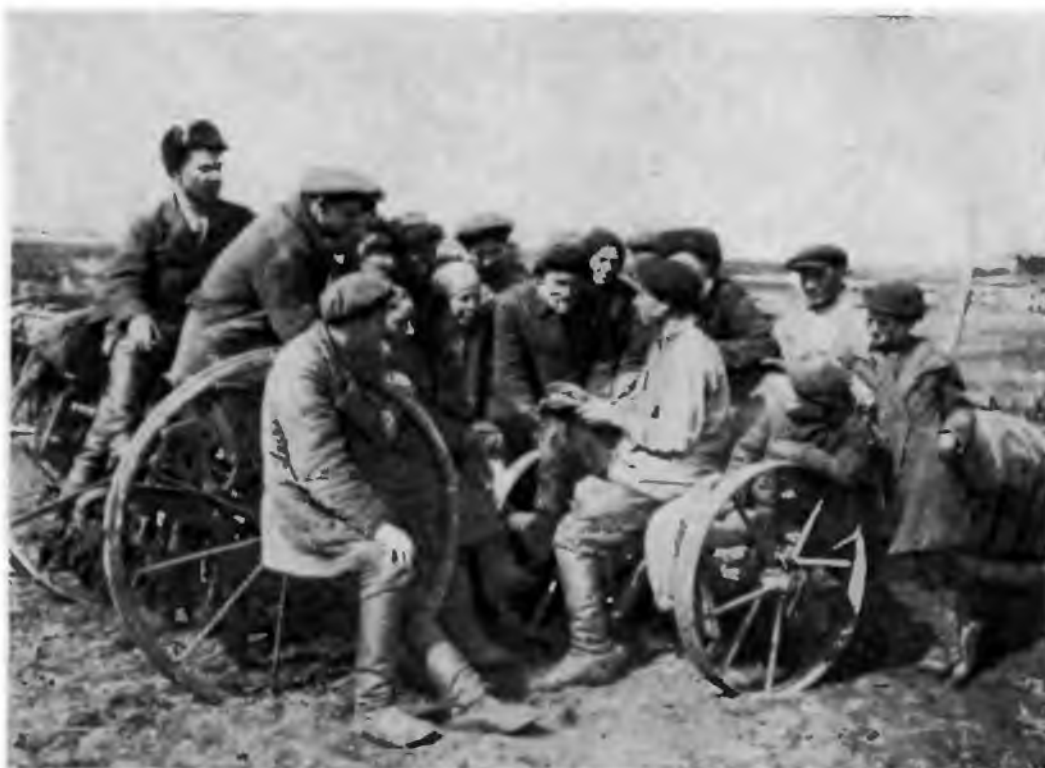
Производственное совещание в колхозе. ДВК. 1932 г.

масштабы подготовки сельскохозяйственных кадров. С 1934 по 1937 г. только МТС Западной Сибири получили свыше 1 тыс. инженерно-технических работников. Начиная с 1933 г. подготовка механизаторских кадров массовой квалификации проходила главным образом на курсах при МТС, а также в специальных государственных школах механизации. В 1935—1936 гг. в Сибири было подготовлено в различных школах и на курсах трактористов около 67 тыс., шоферов — свыше 5 тыс., тракторных бригадиров — 3.5 тыс., механиков — 1.8 тыс., комбайнеров — 8.7 тыс., по-