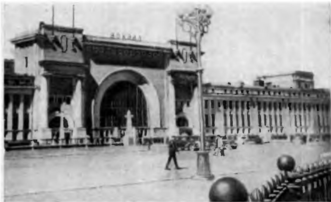
Новый железнодорожный вокзал в г. Новосибирске.

В годы второй пятилетки возникли новые мощные мясоконсервные, мельничные, рыбоконсервные комбинаты, маслодельные, сыроваренные, колбасные, сахарные заводы, кондитерские, макаронные фабрики, хлебокомбинаты, заводы сгущенного молока и т. д. К концу пятилетки работало три сахарных завода — два в Западной Сибири, один на Дальнем Востоке. Почти полностью была реконструирована рыбная промышленность. На Дальнем Востоке в 1937 г. действовал 41 рыбоконсервный завод, в том числе 10 плавучих и 4 жестяно-баночных фабрик. Появились китобойные и краболовные флотилии. Значительно выросло производство продовольственных товаров. Валовая продукция крупной пищевой промышленности за пятилетие выросла почти в три раза. Удельный вес Сибири в валовой продукции пищевой промышленности СССР составил