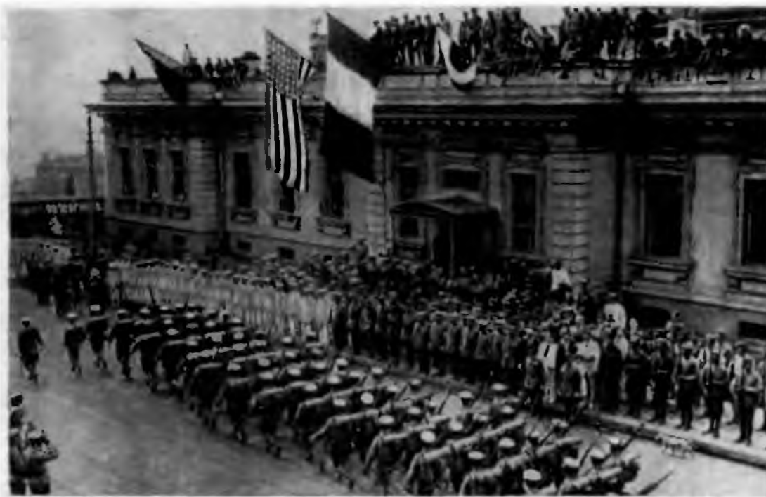
Японские интервенты во Владивостоке. 1918 г.