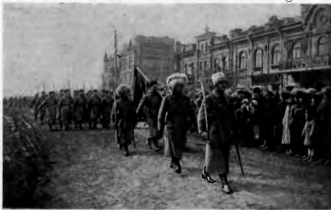
Парад революционных войск в Хабаровске. 1920 г.

кольск-уссурийском, спасском, шкотовском — большевики провели большую организационно-агитационную работу в колчаковских войсках, создали нелегальные группы в частях противника. По решению Дальневосточного комитета РКП(б) общее руководство военной работой осуществлял областной Военно-революционный штаб, который возглавил опытный и авторитетный руководитель С. Г. Лазо. Большевики организовали выпуск нелегальной газеты «Коммунист», распространяли листовки, вели устную агитацию. Все это способствовало мобилизации сил рабочих, солдат и матросов накануне и в момент восстания.