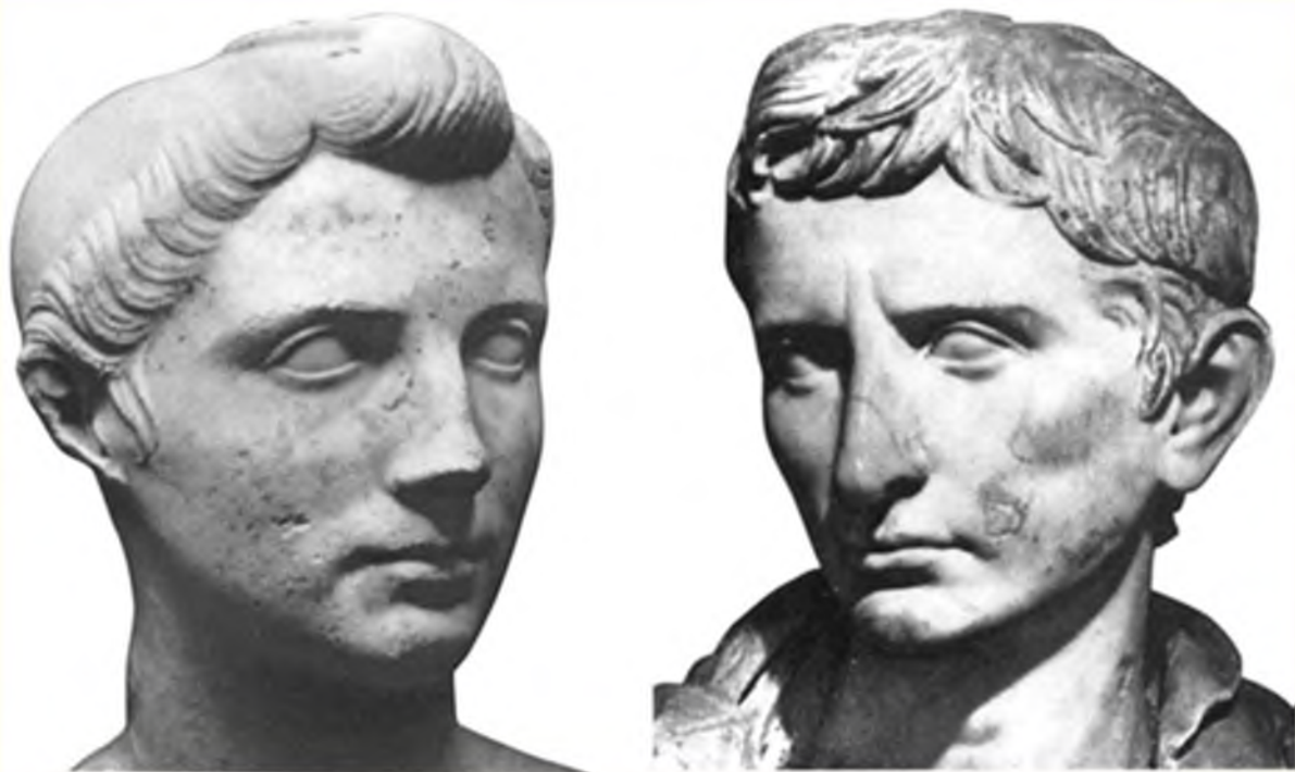
Октавия (Мрамор. Около 40 г. до н. э.), справа – Октавиан (Мрамор. Между 35 – 29 гг. до н. э.)

военачальник Марк Антоний. И наследник Цезаря, бывший к тому же способным учеником, вспомнил о попытке приемного отца уладить неприятности с Помпеем в 54 году до н. э. Увы! Женщины часто являлись разменной монетой в мужских отношениях.