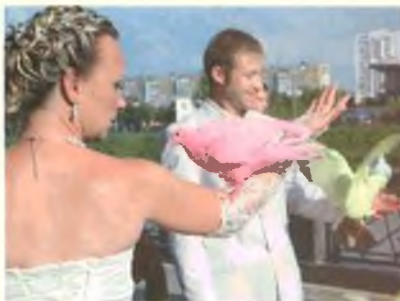
Воркующие голубки: одни — с перьями, другие — без