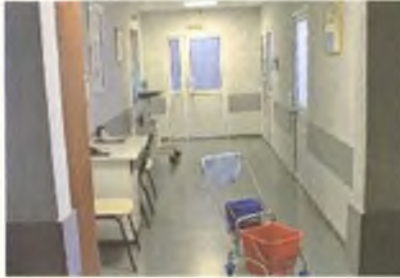
На девятом этаже в Железнодорожной больнице