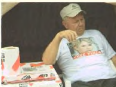
Уставший протестующий под звездой «Мерседеса»