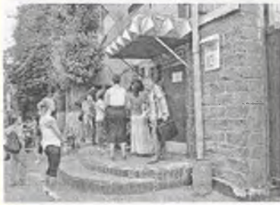
Посетители перед входом в киевское СИЗО

Директор тюрьмы ведет меня к выходу тем же путем, которым мы пришли. Двери открываются, двери закрываются... Крепкое рукопожатие, затем открывается дверь на свободу. Перед входом толпится много людей, в основном женщины, у которых здесь назначено свидание или же они хотят сделать заявку на него. Это те же, что ждали здесь полтора часа назад. Или, возможно, это родные новых заключенных? Я не могу судить. Судя по внешнему виду и одежде, здесь представлены все классы и слои.