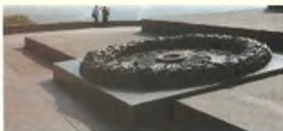
Вечный огонь на киевских холмах