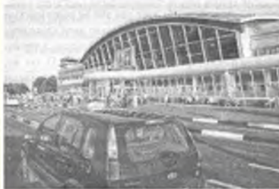
Терминал В аэропорта Борисполь

является автомобиль, все, кто могут позволить себе такие престижные колеса, «украшают» двери своего многотысячного монстра логотипом известной компании.