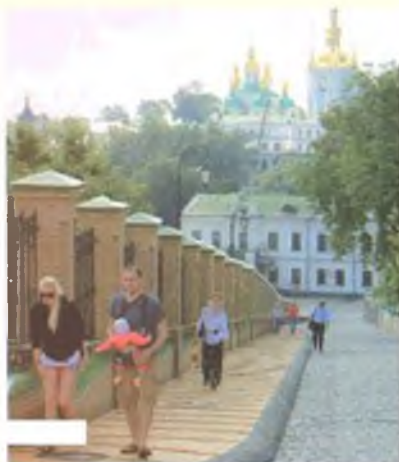
На территории лавры