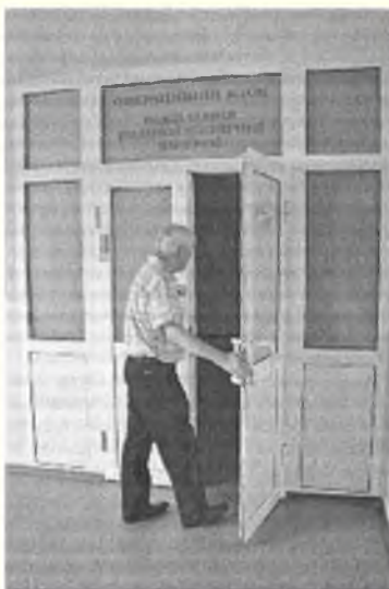
Операционный блок на девятом этаже