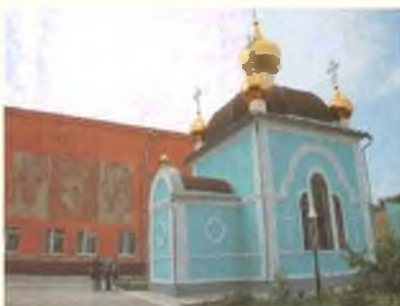
Церковь во внутреннем дворе Качановской колонии