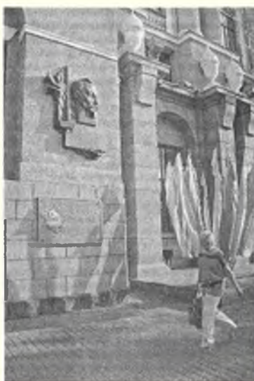
Железнодорожное управление Юго-Западного фронта с барельефом Ф. Э. Дзержинского

Большинство людей, наполняющих площадь, родились спустя многие годы после тех событий, но шрамы и памятник в городе присутствуют, почему это и называется прошлым. Несмотря на некоторые трещины, независимо от того, кто правит в Киеве, ход истории шел и идет, как поток он течет и забирает людей с собой. Время всегда идет вперед.