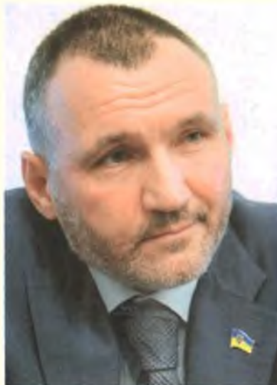
Ренат Кузьмин — первый заместитель Генпрокурора Украины