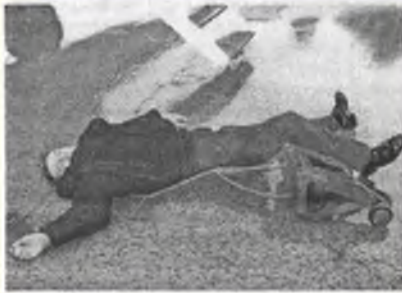
Убитый сотрудник аэропорта