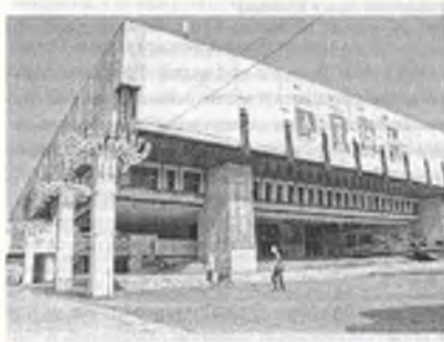
Оперный театр в Харькове

Я прогуливаюсь по другой стороне, направляясь к Дворцу культуры, архитектура которого легко выдает время его возведения. Даже уродливые лампы с шарообразными светильниками, которые попадаются мне на пути, не раскрывают всю безвкусицу четырех архитекторов, которые занимались строительством во времена волнений и развала Советского Союза. И никто им не помешал тогда, потому что во времена перестройки и гласности это было бы расценено как nepозволительная опека. Здание было закончено в 1991 году, после в общей сложности 25 лет строительства. Сейчас оно стало приютом для театра оперы и балета, который еще в 1829 году был основан в Харькове. Также в этой развалине-коробке показывают кино. Возможно, помещения внутри выглядят вполне сносно, а я всего лишь неправильно представляю себе их авторов.