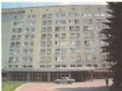
«Волга» «Коли» перед Железнодорожной больницей