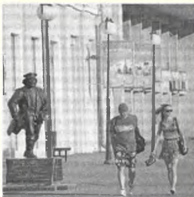
«Отец Фёдор» из «12 стульев» И. Ильфа и Е. Петрова на перроне в Харькове

должен присутствовать и дирижер. А вот как раз и он, стоит внизу. Знаками он показывает, как должны голосовать депутаты фракции — горизонтально поднятая рука значит «нет», поднятая и сразу опущенная рука — и все нажимают «да».