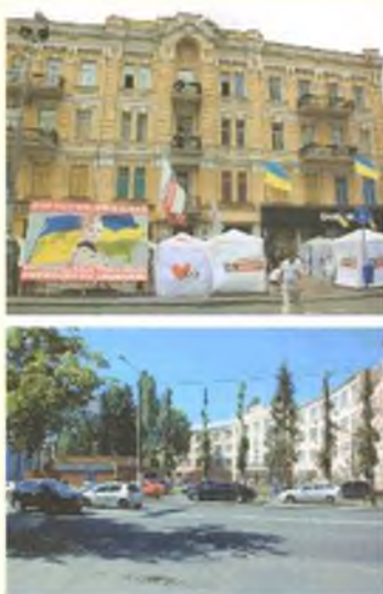
Здание Государственной пенитенциарной службы Украины на ул. Мельникова, 81 в Киеве

Юлия Тимошенко слегка натягивает свой серый свитер на живот и кладет на него ладонь, в то время как левой рукой она тянет расстегнутое на животе модное пальто вниз. На бедрах можно заметить темноватое пятно, которое при желании можно интерпретировать как гематому. Белокурая коса декоративно лежит спереди на ее груди, на кровати также лежат красный футляр для очков (кстати, недешевой итальянской марки Москино) и синяя записная книжка со вставленной шариковой ручкой, что заставляет думать: она работает.