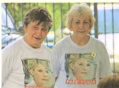
Протестующие перед больницей в Харькове