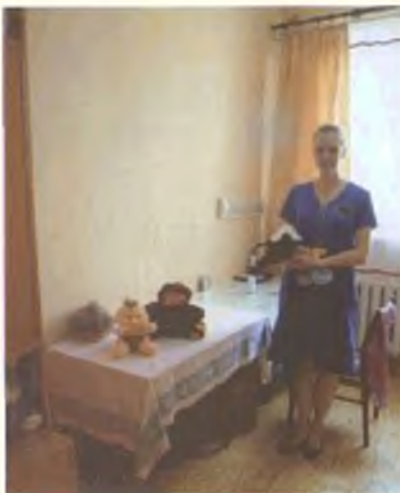
Здесь делают плюшевые игрушки