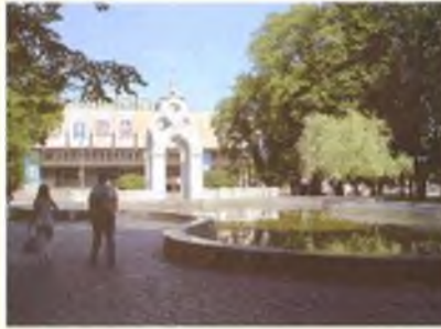
Харьков, «Зеркальная струя»