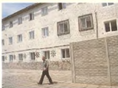
Камера Тимошенко — с двумя зарешеченными окнами