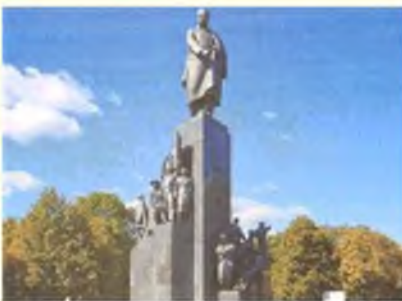
Памятник Тарасу Шевченко в Харькове