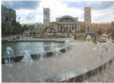
Вокзал Харькова и площадь с фонтанами перед ним