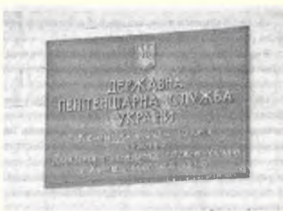
Вывеска на входе в женскую колонию № 54

Я сказал, что фактически он был приговорен к пожизненному заключению, на что он с согласием кивнул в ответ. Что он потом будет делать дальше, поинтересовался я. Жить, ответил он, просто свободно жить и только.