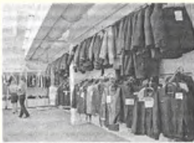
Одежда, которую шьют заключенные