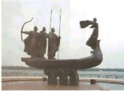
Памятник основателям Киева