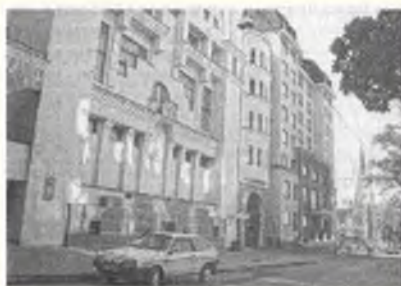
Вид на ул. Гоголя в Харькове, сзади — отель «Чичиков», спереди — театральная академия

Однако все дело проваливается, и попытки мультимиллионера морально очистить Чичикова терпят неудачу из-за его отношения к своим поступкам: «Но я не чувствую отвращения к греху: я измученный, я не чувствую никакой любви к добру». В конце книги нераскаявшегося грешника помиловали и выслали из страны. На свои последние деньги он незадолго до отъезда позволяет себе пошить богатый костюм на заказ — чтоб продолжать свое дело дальше.