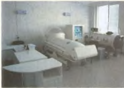
В Железнодорожной больнице