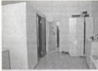
Дверь камеры изнутри

На последней двери справа светло-серыми буквами по-русски написано «Камера 260».