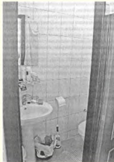
Вид туалета в камере

На последней двери справа светло-серыми буквами по-русски написано «Камера 260».