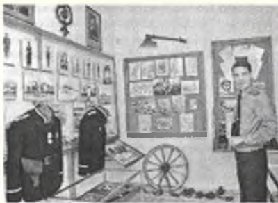
В музее с молодым майором

Я грустно смотрю на часы — через полчаса на другом конце столицы меня ждет 1-й заместитель Генерального прокурора, говорю я. Майор понимает и просит меня расписаться в книге посещений. Хорошо, говорю, такая сделка весьма приемлема: один автограф за разрешение от его ведомства посетить, по крайней мере, две колонии. Без всякого лицемерия я хотел бы похвалить наглядность экспозиции музея и подчеркнута трепетное отношение к прошлому людей, причастных к его работе.