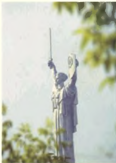
Памятник в честь Победы — «Родина-Мать», высотой 102 метра